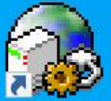
FTP Utility Settings